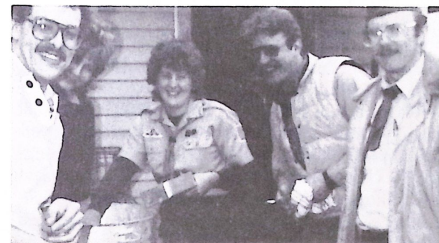
Itt is kell mosogatni!