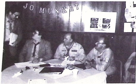
A szavazat vizsgálók.