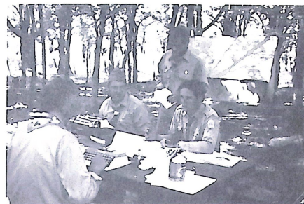
A Petunia őrs kiképzés alatt.