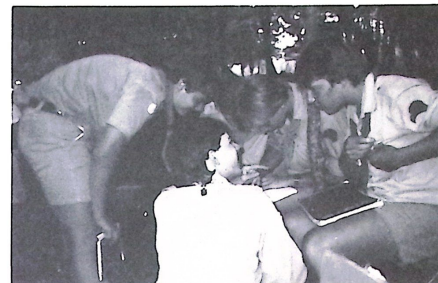
A jelöltek tanakodnak.