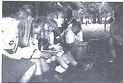
A vezetők „ügyműködnek”.