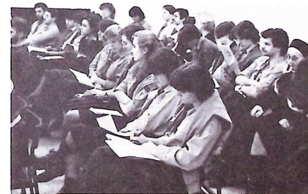
Az európai tisztikonferencia hallgatói.