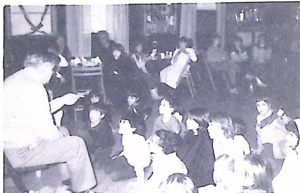
Jóska bá mesél.