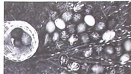
Ez mind a táborban készült.

De nemcsak szórakozás volt ez a tábor: sokat tanultak a résztvevők, sok szép vallásos élmény, a magyar nép „lelkének” mélyebb ismerete tették gazdaggá ezt a négy napot. Köszönet mindazoknak, akik ezt a táborot előkészítették, levezették és lehetővé tették, hogy ezekben az élményekben részestillettünk!