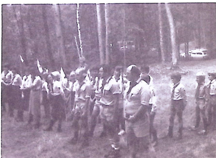
A 19. sz. Hunyadi Mátyás cscs., Chicago, USA.