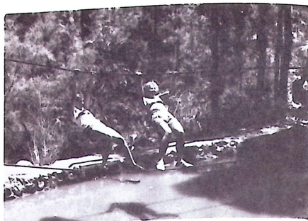
Jaj, bele ne essünk!

A táborparancsnok búcsúbeszéde, úgy hiszem, mindannyiunknak szól: „A tábor szép napjai elröppentek, a jó Isten velünk volt eddig, mindenkinek volt alkalma valamit tanulni és tapasztalatokat szerezni, alkalma volt gyarapodni a cserkészismeretekben, a közös együttélésben, gyönyörködni a természetben és a madarak dalában... s alkalmatok volt egy kicsit belepillantani a magyar múltba, annak történelmébe. Isten veletek, ne hagyjátok elcsábítani magatokat a modern világ léha, igen sokszor romlásba vezető életmódjától, hanem legyetek gerinces, Isten-félő, erkölcsös magyarok, cserkészek. Legyetek büszkék ősseitekre, fajtátokra.”