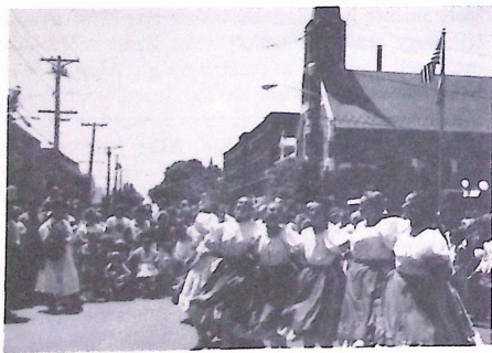
A new-brunswicki regőscserkészek a Magyar Napon.