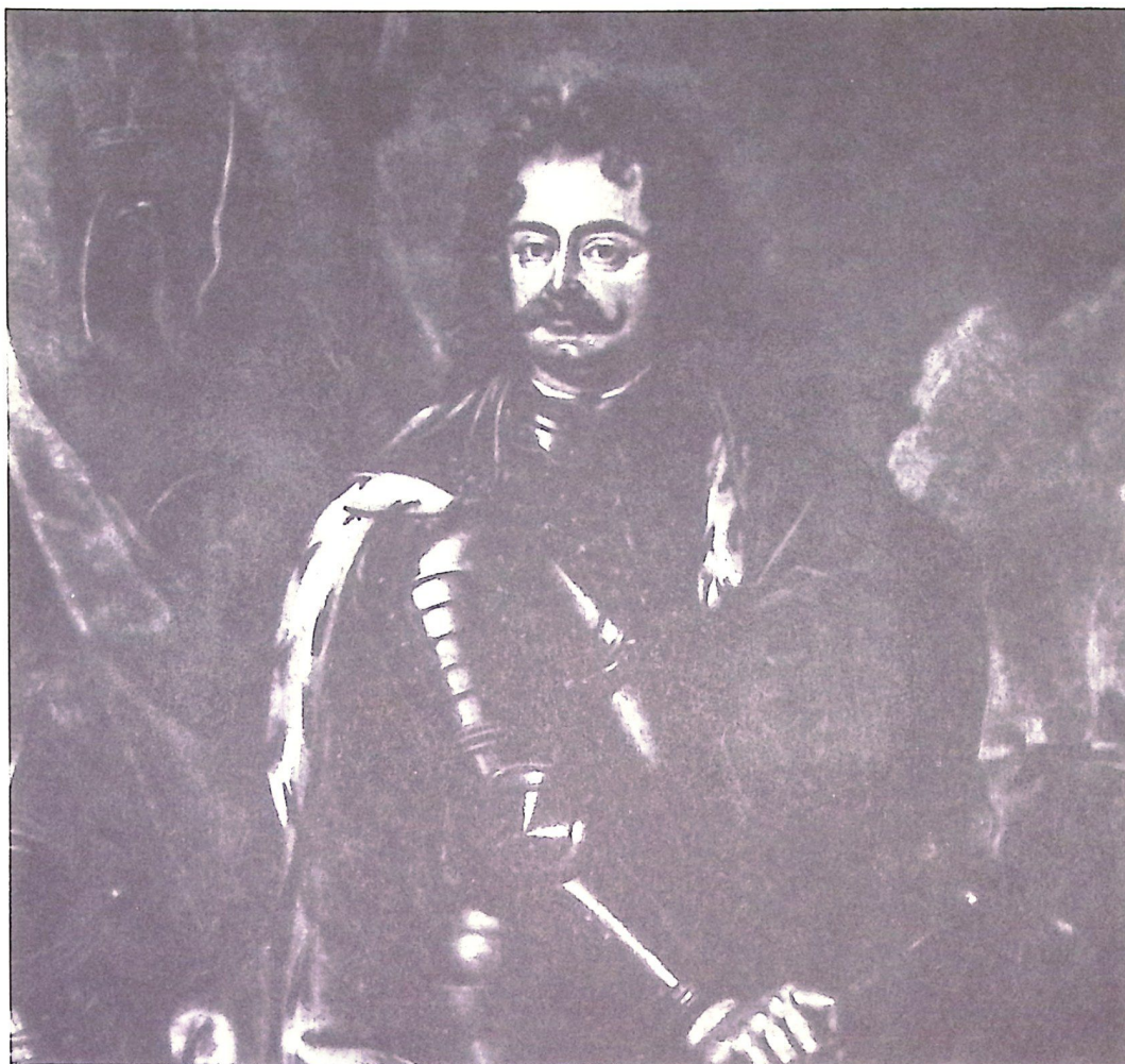
II. Rákóczi Ferenc erdélyi fejedelem.

Az idei év kettős jubileum jegyében indul. Idén ünnepeljük a magyar cserkész 75., és a száműzött cserkész 40. évfordulóját. Ebben az esztendőben emlékezünk meg II. Rákóczi Ferenc, Magyarország vezérlő fejedelme halálának 250. évfordulójáról.