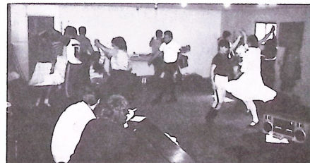
Népijáték — tánc.