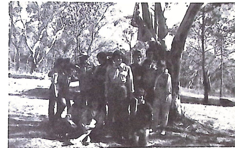
A Hollós Mátyás csct. kiránduláson.

52. sz. Hollós Mátyás csct. Melbourne, Ausztrália