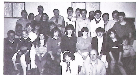
A Regős tábor résztvevői.